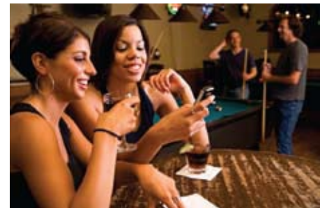
Ihre Kunden erhalten eine Auftragsbestätigung, Information zum Taxi und Ankunftszeit