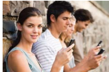
Es ist so einfach und bequem ein Taxi zu bestellen