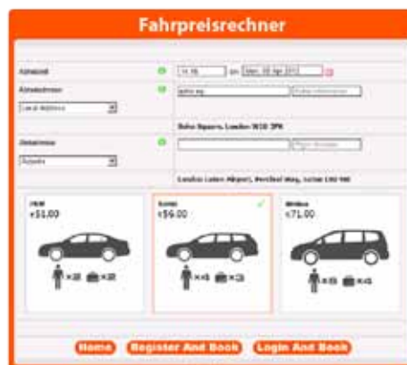
Visuelle Darstellung der Tarife

Das Cordic Web Booker System ist in hohem Maße konfigurierbar, einfach zu implementieren, arbeitet automatisch und autonom parallel zu Ihrer Zentralvermittlung.