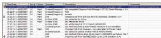
Finden Sie relevante Aufzeichnung schnell